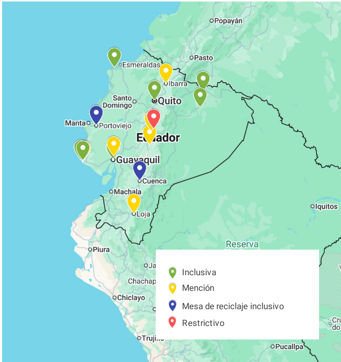
Figura 3. Ordenanzas municipales para el reciclaje inclusivo. Ver enlace interactivo aquí .

También se han implementado documentos de orientación en el país, incluyendo el Libro Blanco para la Economía Circular (MPCEIP et al., 2021) y la Estrategia Nacional para la Economía Circular Inclusiva (MPCEIP & MAATE, 2024), entre otros, que sí incluyen al reúso en sus recomendaciones. Sin embargo, estos documentos no son vinculantes y no abordan en profundidad el rol de los y las recicladoras en el reúso con indicadores operativos. Ecuador fue el primer país de la región en instituir una hoja de ruta nacional a partir de la Alianza Mundial para la Acción por el Plástico (GPAP, por sus siglas en inglés) 8 . Según la hoja de ruta, la transición de Ecuador a la circularidad con respecto al plástico del 8% al 42% en 2040 requeriría que se reutilicen al menos 129 kilotoneladas de materiales (GPAP, 2023). En este escenario, se deberán diseñar e implementar múltiples estrategias para el reúso, muchas de las cuales deberían involucrar a los y las recicladoras. En el contexto del Tratado Global de Plásticos 9 , cuya