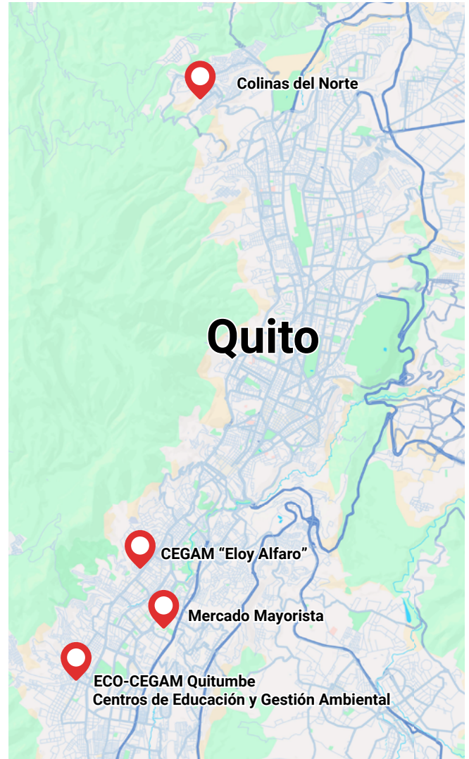
Figura A1: Distribución de las operaciones de los y las recicladoras de Quito