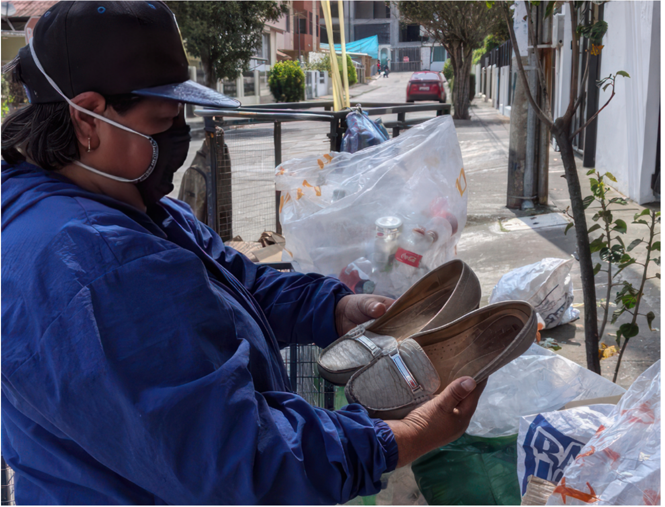
Figura 2: Recicladora recolectando zapatos usados.