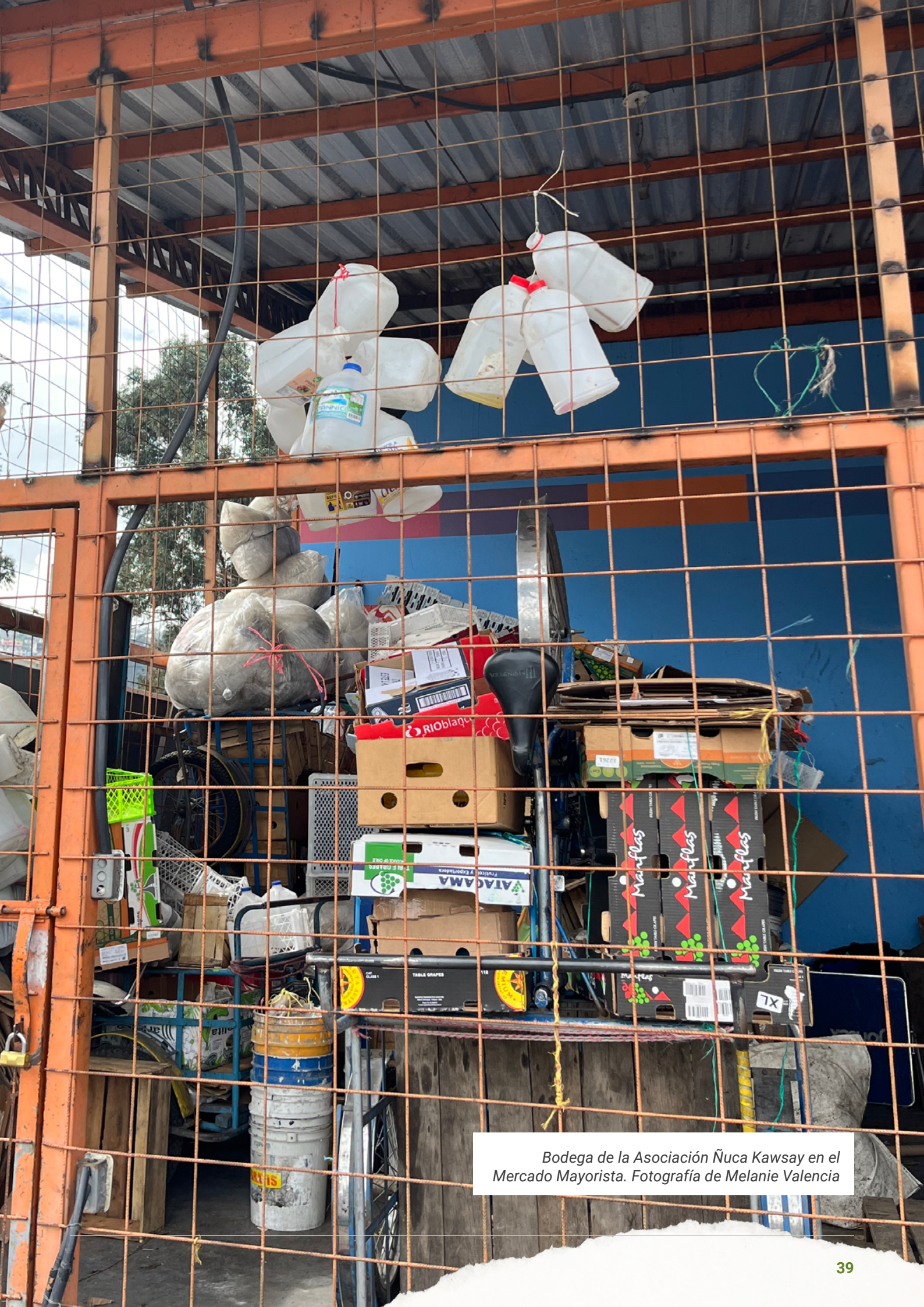
Bodega de la Asociación Ñuca Kawsay en el Mercado Mayorista.