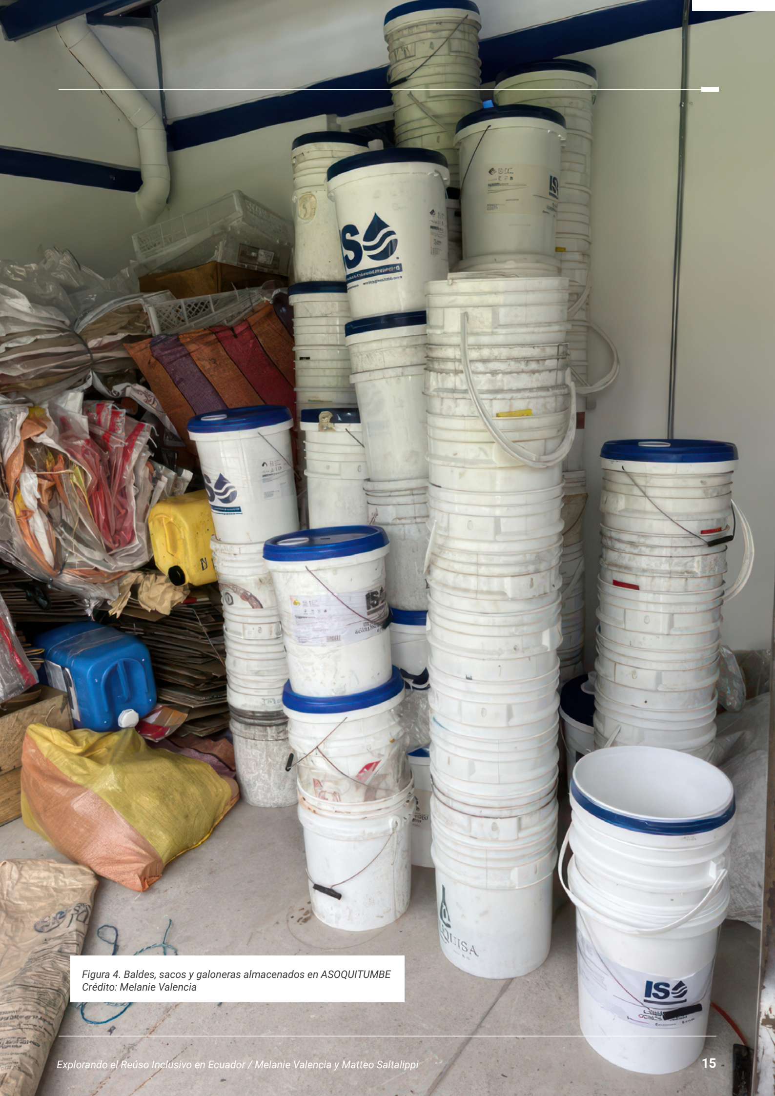
Figura 4. Baldes, sacos y galoneras almacenados en ASOQUITUMBE